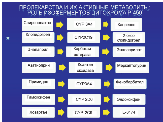
Рис. 2. Примеры пролекарств, активные метаболиты которых образуются с участием ферментов биотрансформации [7]

При проведении фармакотерапии особое внимание необходимо уделять тем ЛС, которые имеют активные метаболиты, образующиеся в процессе биотрансформации. Существуют ЛС, изначально неактивные, и лишь в результате биотрансформации из них образуются активные метаболиты, определяющие фармакодинамические эффекты (рис. 2) [7].